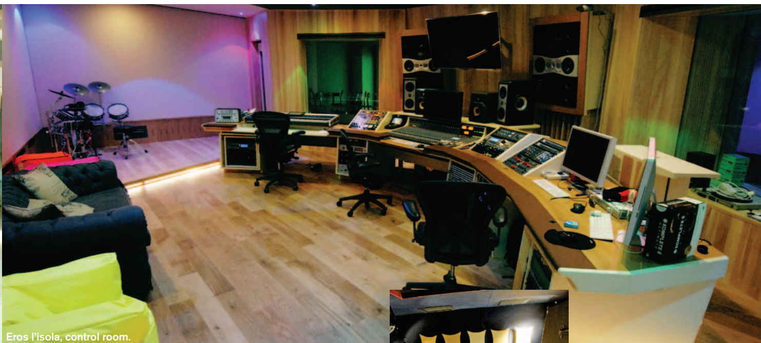
Eros l'isola, control room.

personalizzato e fatto "su misura". Ogni volta esce un pezzo unico. Nella seconda, invece, l'idea è di pensare a qualcosa di più accessibile. E la mia collaborazione con Boxy e B-BEng va in questo senso.